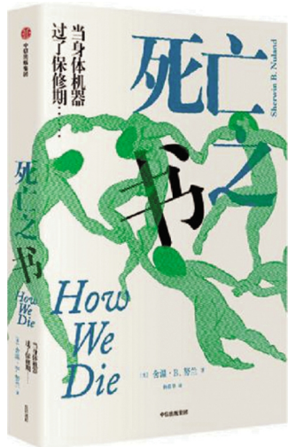
《死亡之书》:舍温·努兰 [美]著,杨慕华译,中信出版集团 2018年8月出版,定价:58元

16世纪人文主义思想家蒙田曾说过:“生命的用处,不在于寿命的长短,而在于时间的运用;一个人可能活得很久,却只‘活’了一点点。”