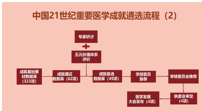
中国21世纪重要医学成就遴选流程