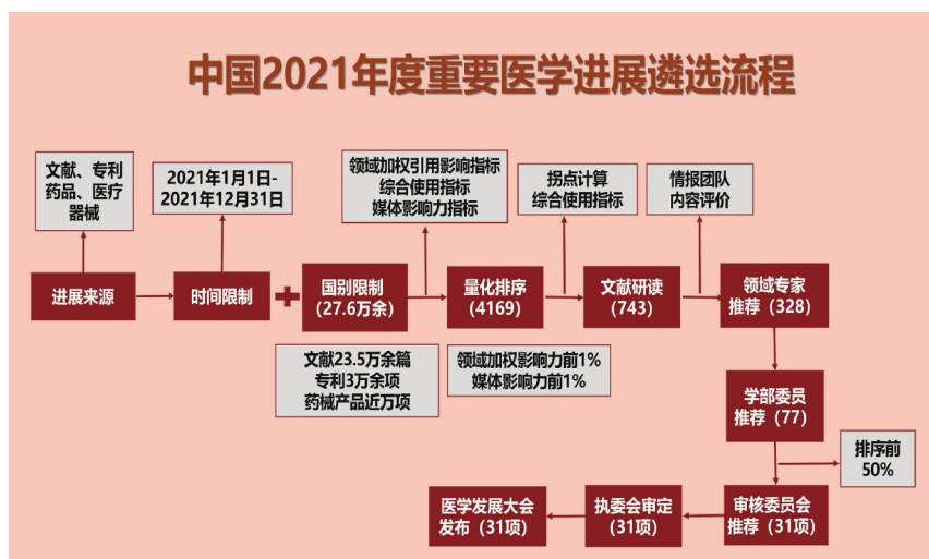
中国2021年度重要医学进展遴选流程

得的医学进展，包括文献、专利、药品、医疗器械等。总共收集了27.6万多条的原始数据，包括文献23.5万多篇、专利3万多项，还有近万项的药械产品信息。这些信息经过定量计算、专家定性分析研讨、学部委员推荐、审核委